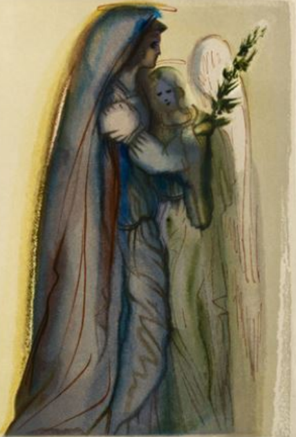
Da "Illustrazioni della Commedia" Salvador Dalí