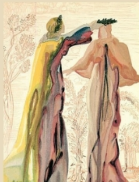
Da "Illustrazioni della Commedia" - Salvador Dalí

DANTE E IL CAMMINO EDUCATIVO ALL'INTERNO DELLA COMMEDIA 30/10/2024 SALA CONVEGNI ASL BI 16.30 - 18.30