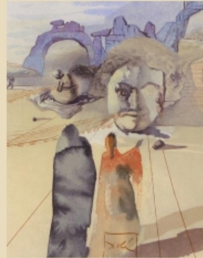
Da "Illustrazioni della Commedia" - Salvador Dalí

DANTE E IL CAMMINO EDUCATIVO ALL'INTERNO DELLA COMMEDIA 30/10/2024 SALA CONVEGNI ASL BI 16.30 - 18.30