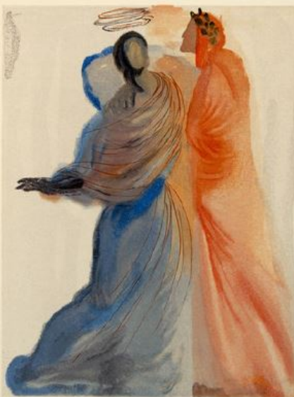
Da "Illustrazioni della Commedia" Salvador Dalí

S.S. Formazione e Sviluppo Risorse Umane ASL BI. tel. 015/1515 3218 rosa.introcaso@aslbi.piemonte.it