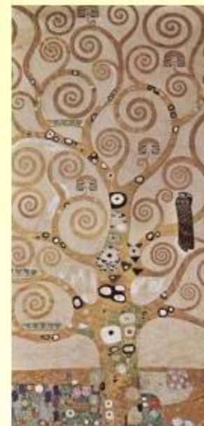
"L'albero della vita" (pannello centrale), Gustav Klimt, 1907 Palazzo Stoclet – Bruxelles