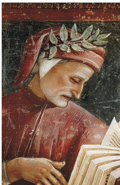
Luca Signorelli, Affresco, Cattedrale di Onivieto

S.S. Formazione e Sviluppo Risorse Umane